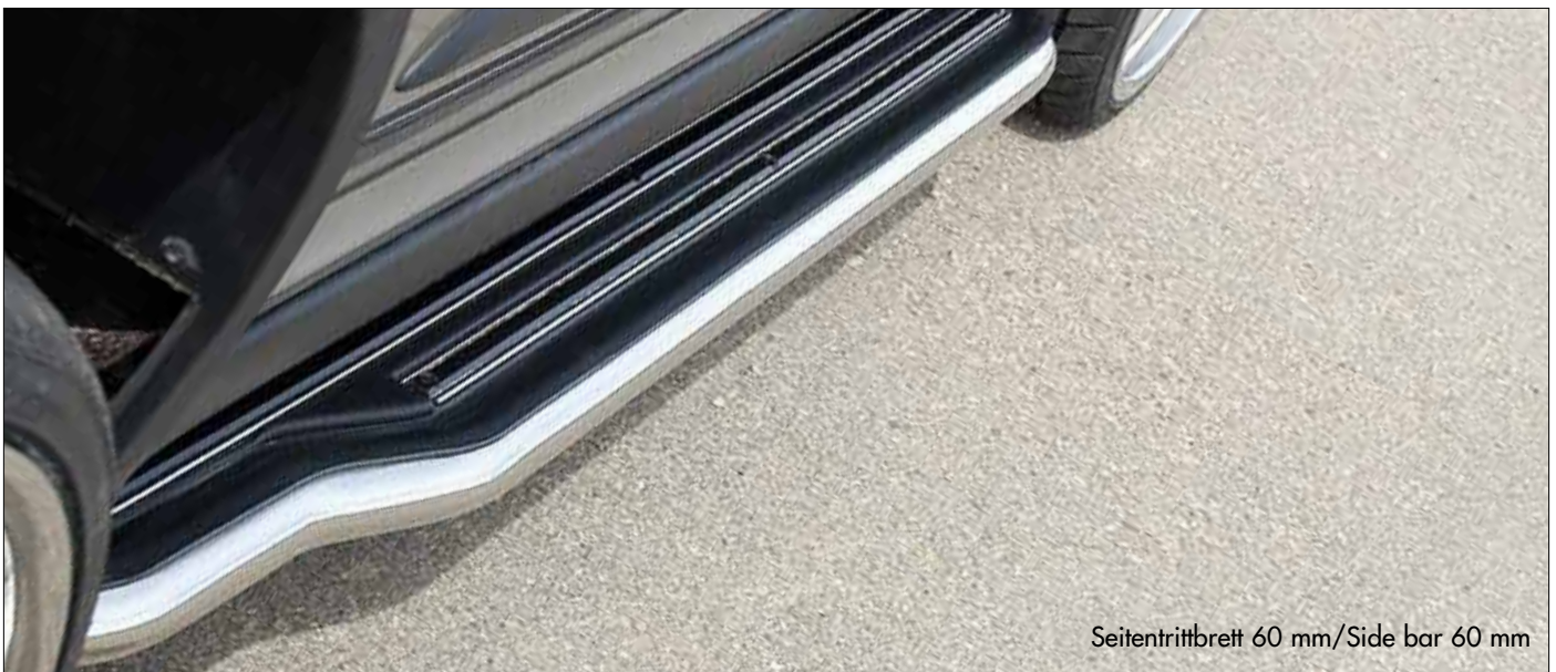
Seitentrittbrett 60 mm/Side bar 60 mm