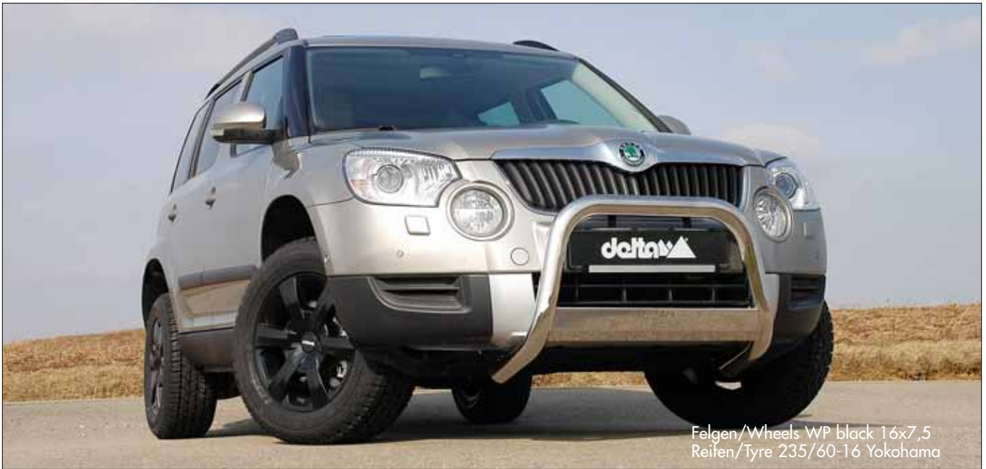
Felgen/Wheels WP black 16x7,5 Reifen/Tyre 235/60-16 Yokohama