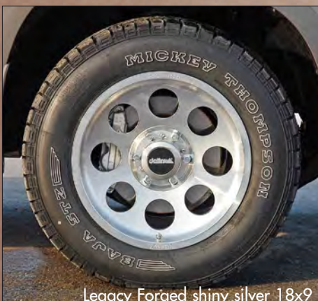
Legacy Forged shiny silver 18x9