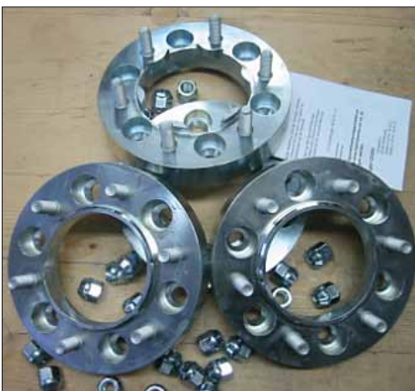
Distanzplatten ver- breitern die Spur um 60 mm pro Achse. Mit Teilegutachten.