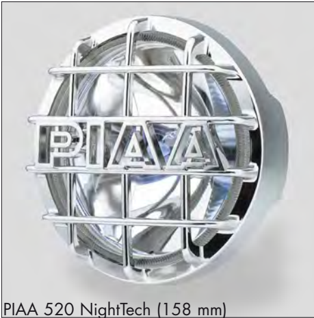
PIAA 520 NightTech (158 mm)