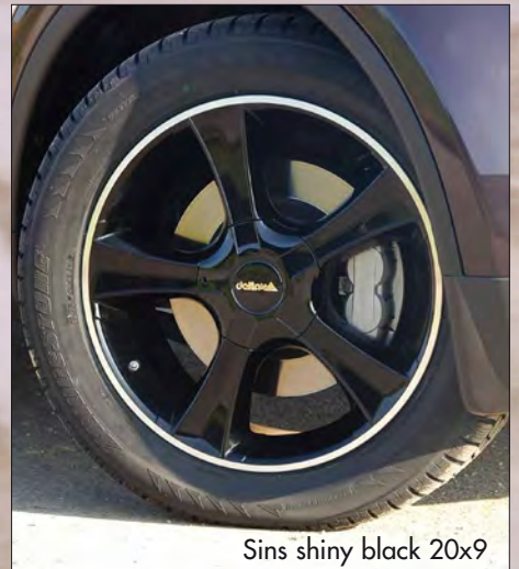
Sins shiny black 20x9