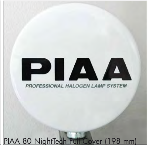
PIAA 80 NightTech Full Cover (198 mm)