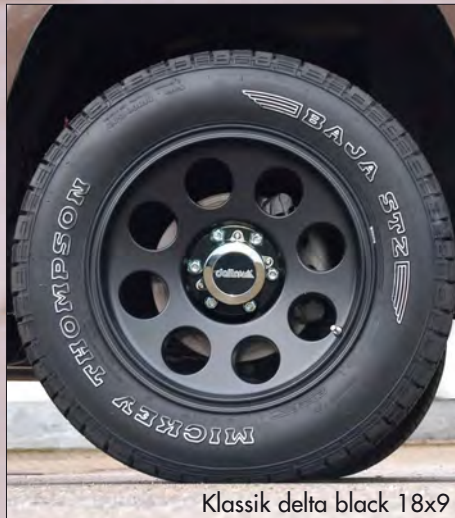
Klassik delta black 18x9