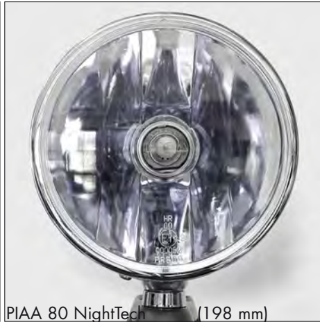
PIAA 80 NightTech (198 mm)