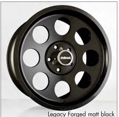
Legacy Forged matt black