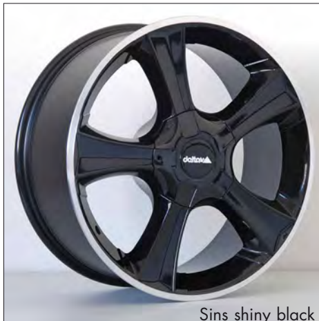
Sins shiny black