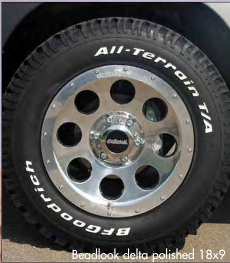
Beadlook delta polished 18x9