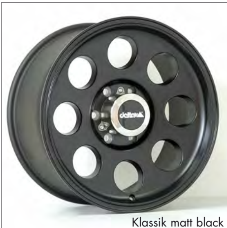
Klassik matt black