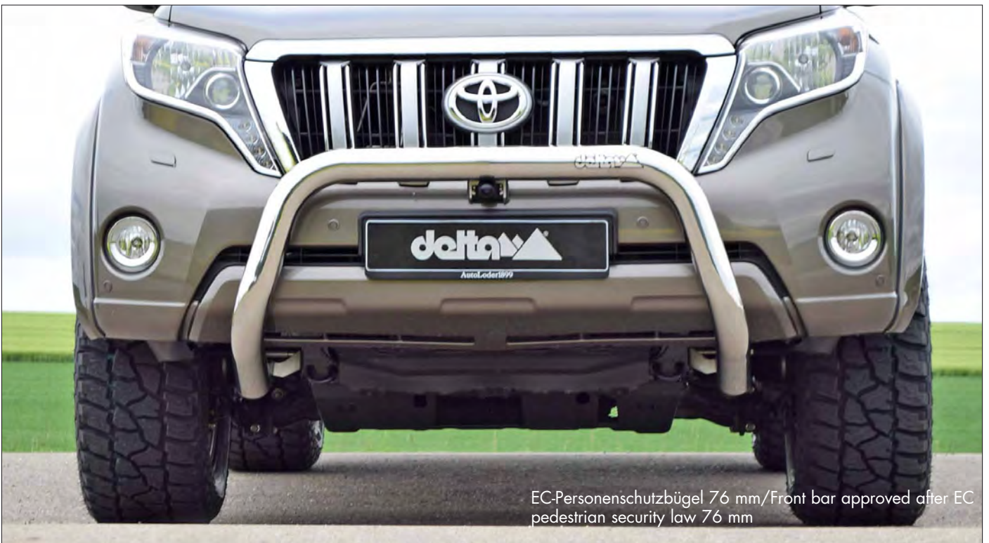
EC-Personenschutzbügel 76 mm / Front bar approved after EC pedestrian security law 76 mm