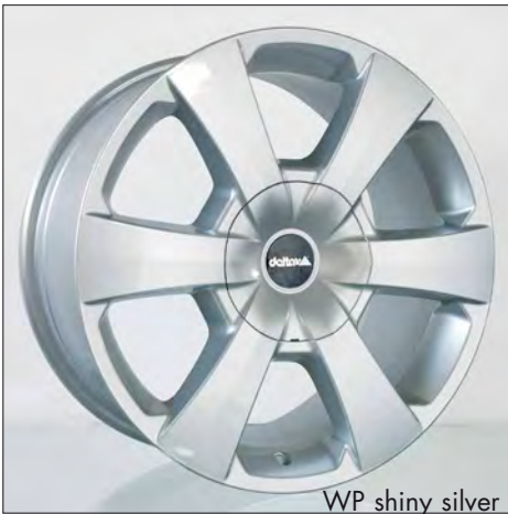
WP shiny silver