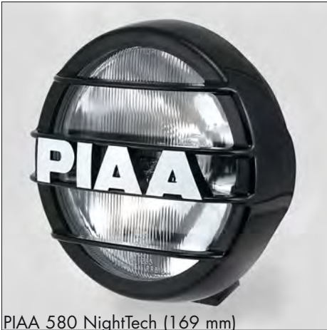
PIAA 580 NightTech (169 mm)