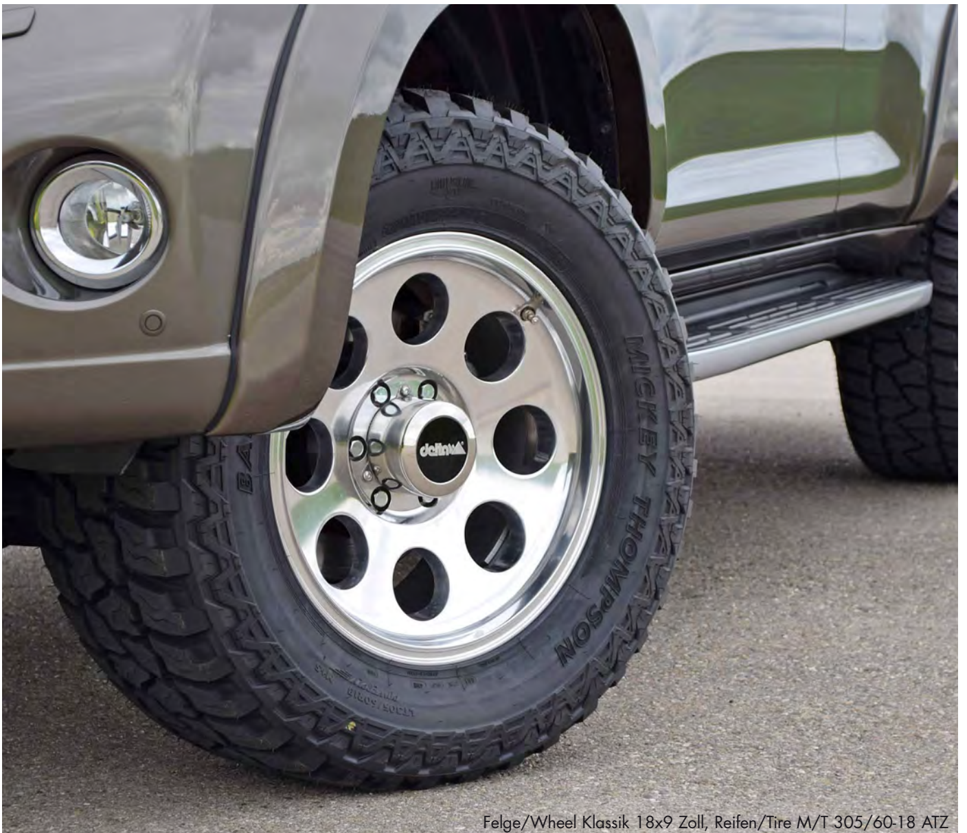
Felge/Wheel Klassik 18x9 Zoll, Reifen/Tire M/T 305/60-18 ATZ