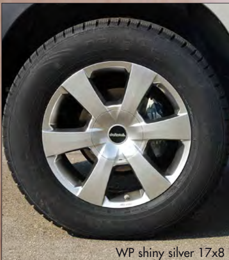
WP shiny silver 17x8