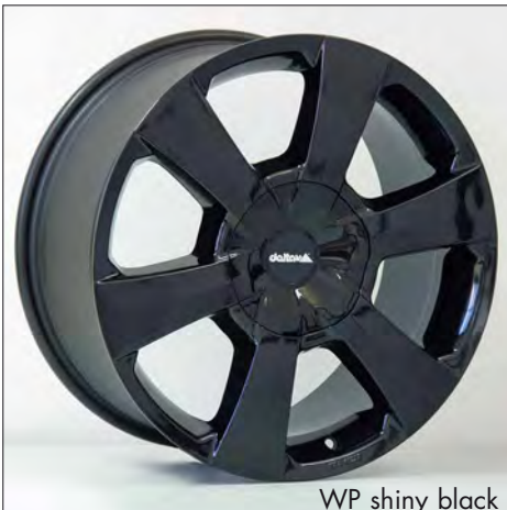
WP shiny black