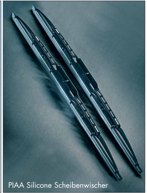
PIAA Silicone Scheibenwischer

Scheinwerferhalterung für Sports bar/ Mounting kit for lights for sports bar