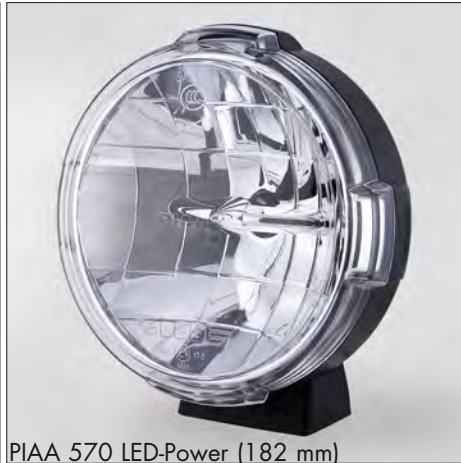
PIAA 570 LED-Power (182 mm)