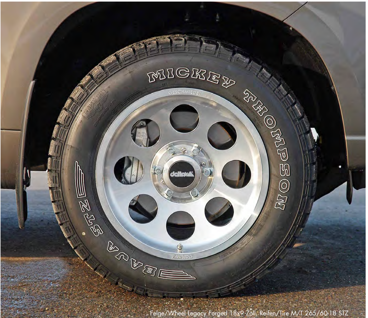
Felge/Wheel Legacy Forged 18x9 Zoll, Reifen/Tire M/T 265/60-18 STZ