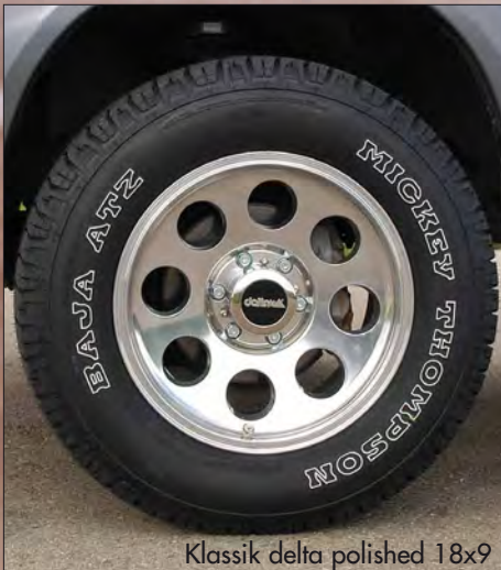
Klassik delta polished 18x9