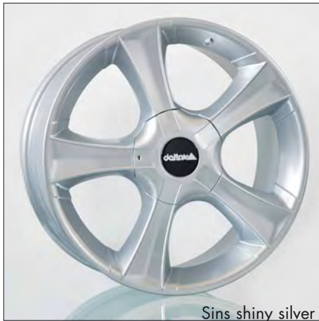
Sins shiny silver