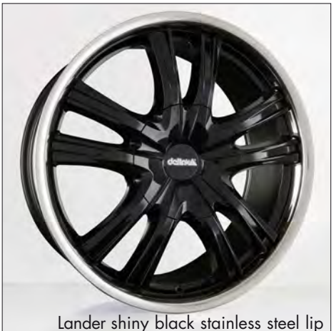
Lander shiny black stainless steel lip