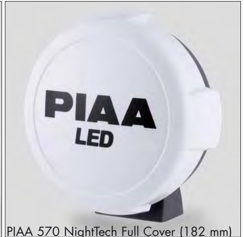
PIAA 570 NightTech Full Cover (182 mm)