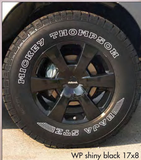
WP shiny black 17x8