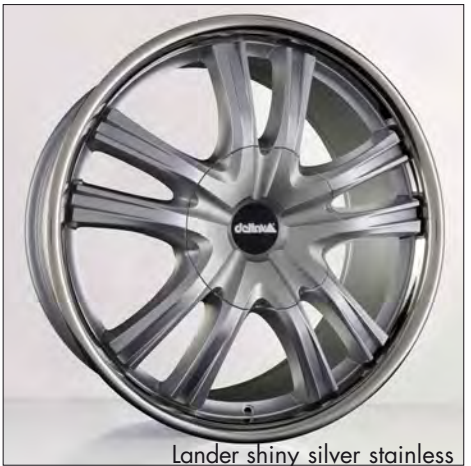
Lander shiny silver stainless