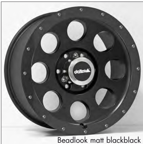
Beadlook matt black