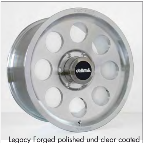
Legacy Forged polished und clear coated