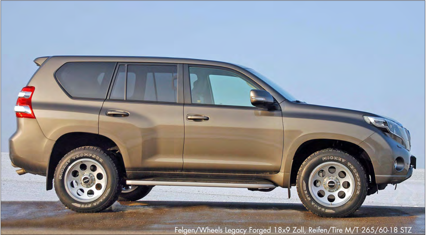
Felgen/Wheels Legacy Forged 18x9 Zoll, Reifen/Tire M/T 265/60-18 STZ