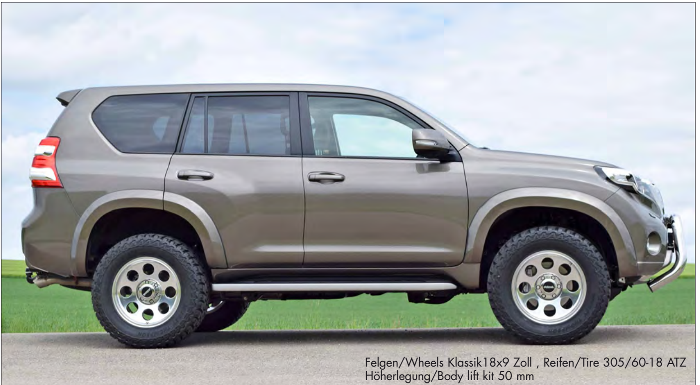
Felgen/Wheels Klassik 18x9 Zoll, Reifen/Tire 305/60-18 ATZ Höherlegung/Body lift kit 50 mm