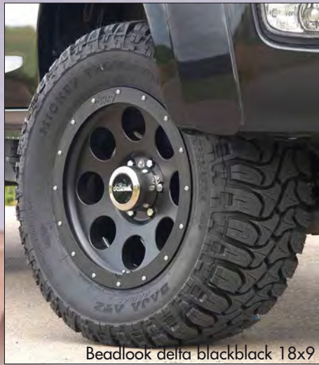
Beadlook delta blackblack 18x9