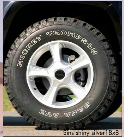
Sins shiny silver 18x8