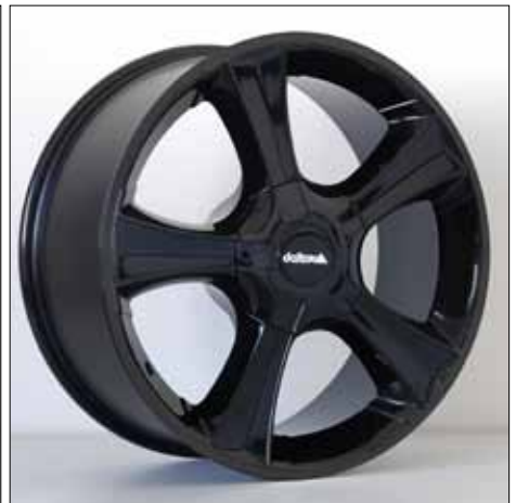
Felge/Wheel Sins blackblack