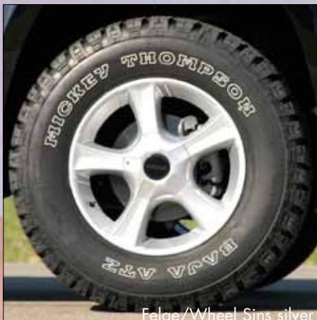
Felge/Wheel Sins silver