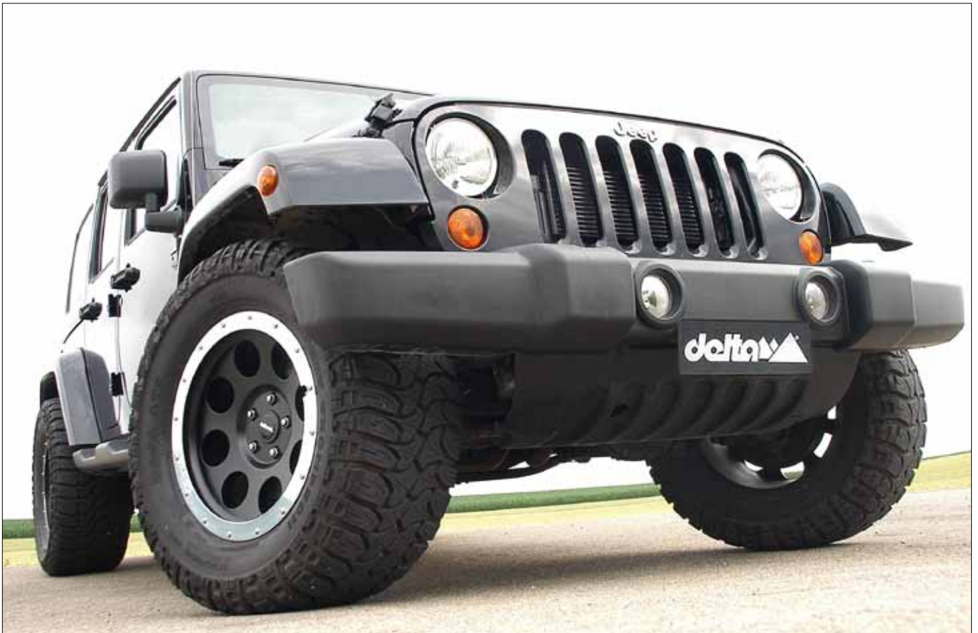
Felgen/Wheels Beadlock delta black 18x9 Reifen Mickey Thompson 305/60-18 ATZ