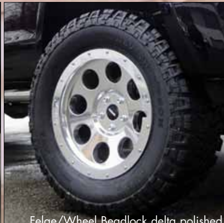
Felge/Wheel Beadlock delta polished