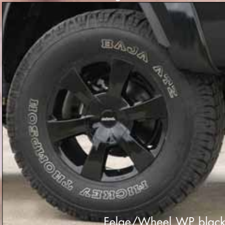
Felge/Wheel WP black