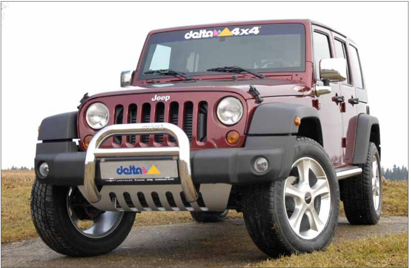
Felgen/Wheels Sins silver 18x8 Reifen 265/60-18