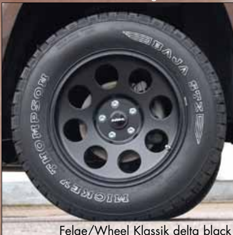
Felge/Wheel Klassik delta black