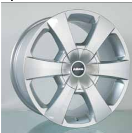
Felge/Wheel WP silver