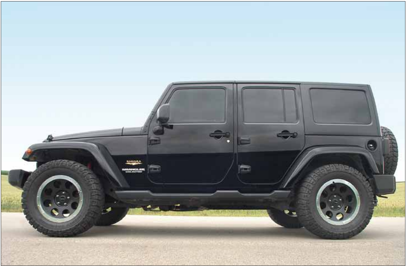
Felgen/Wheels Beadlock delta black 18x9 Reifen Mickey Thompson 305/60-18 ATZ