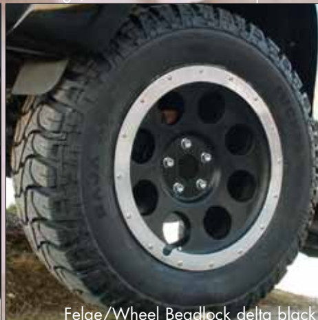
Felge/Wheel Beadlock delta black