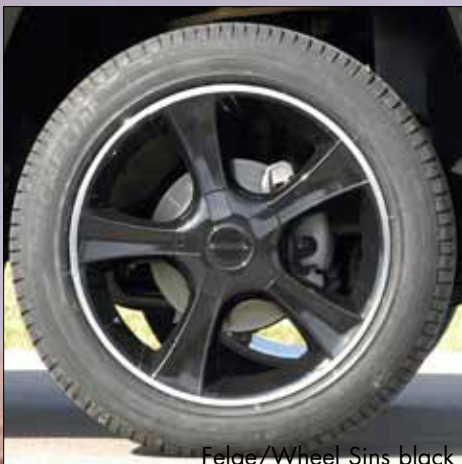
Felge/Wheel Sins black