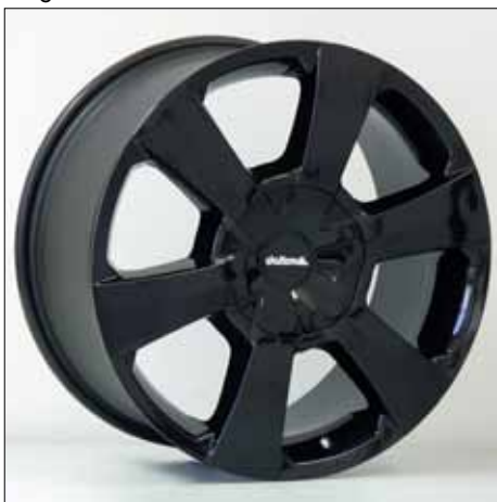
Felge/Wheel WP black