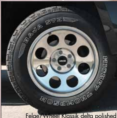
Felge/Wheel Klassik delta polished