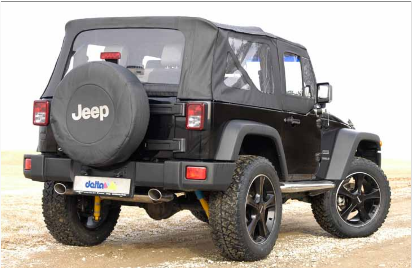
Felgen/Wheels Sins black 20x9 Reifen 275/60-20