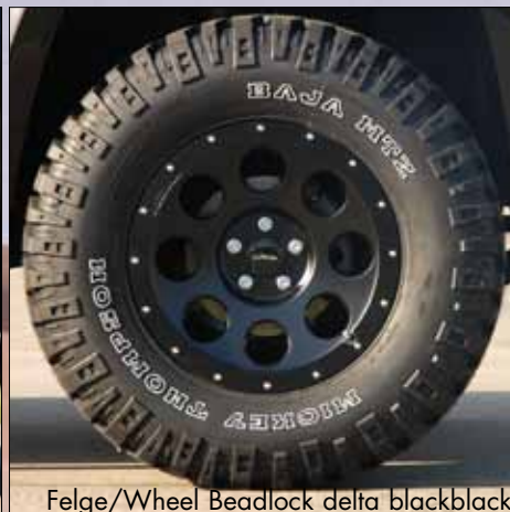
Felge/Wheel Beadlock delta blackblack