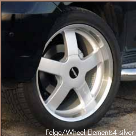
Felge/Wheel Elements4 silver