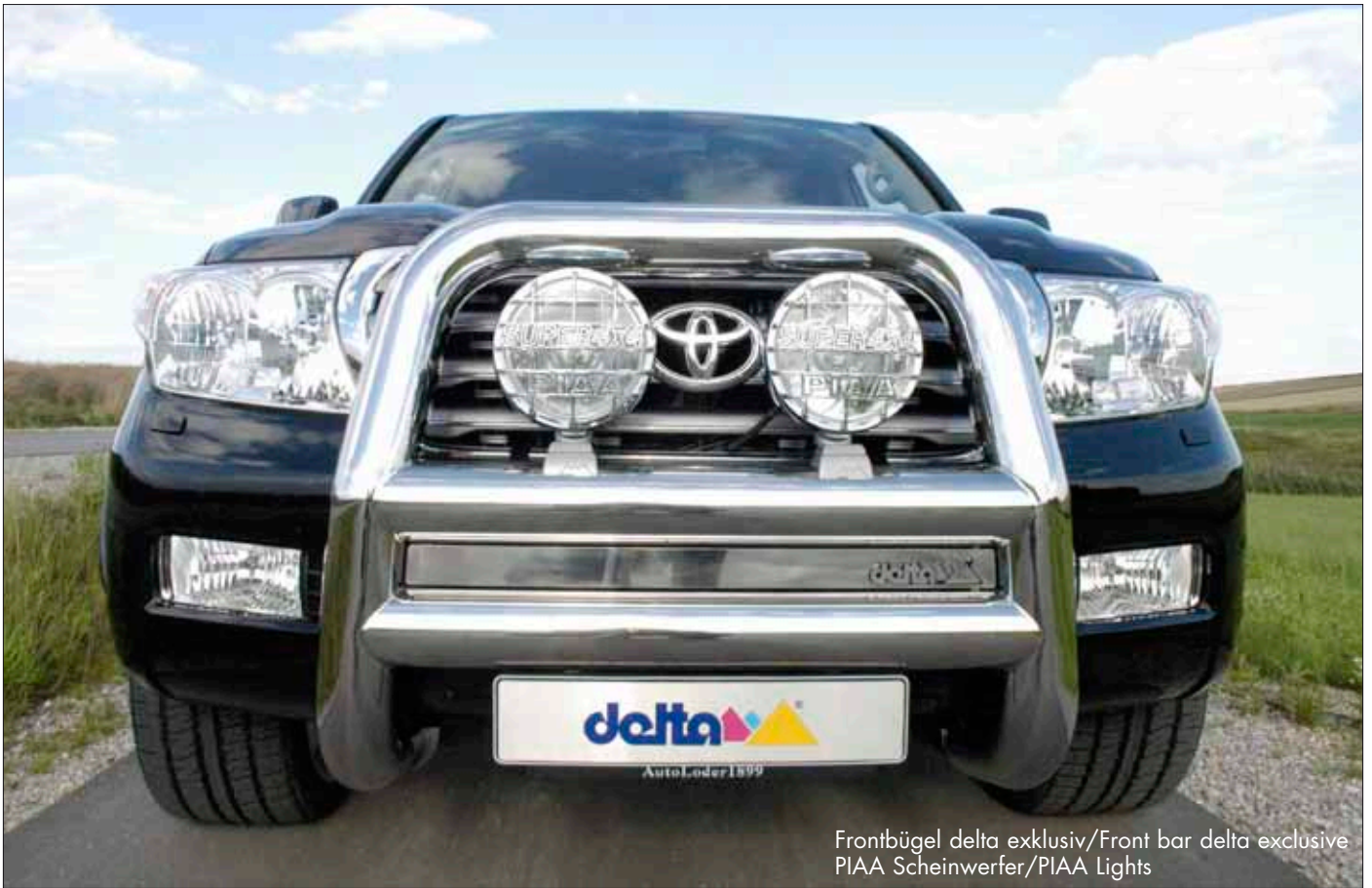
Frontbügel delta exklusiv/Front bar delta exclusive PIAA Scheinwerfer/PIAA Lights