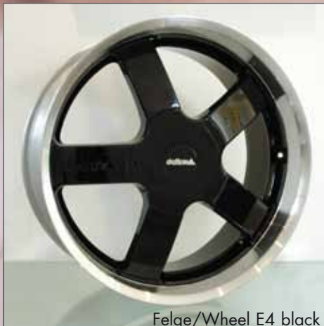
Felge/Wheel E4 black