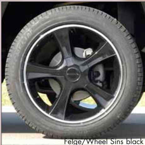
Felge/Wheel Sins black