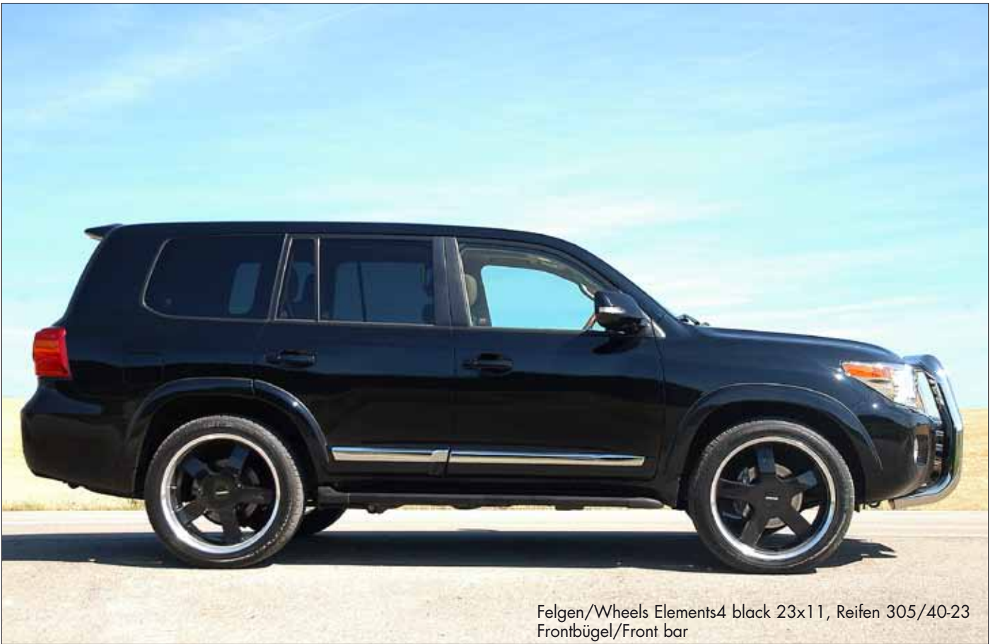
Felgen/Wheels Elements4 black 23x11, Reifen 305/40-23 Frontbügel/Front bar