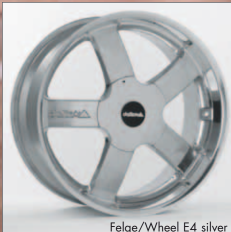
Felge/Wheel E4 silver