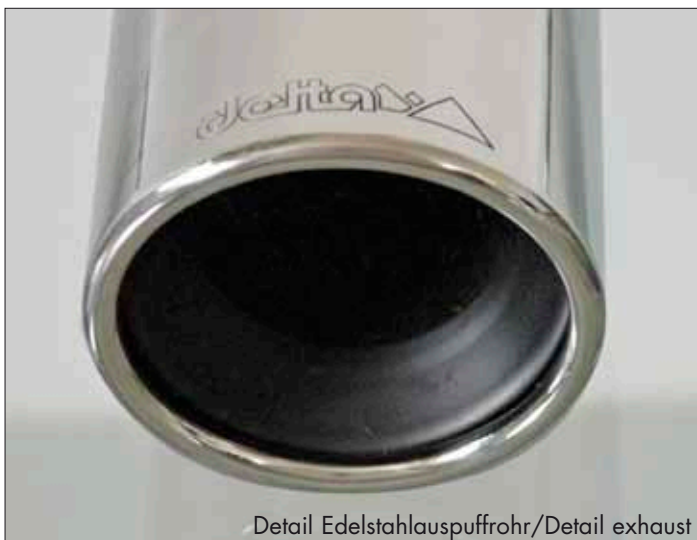
Detail Edelstahlauspuffrohr/Detail exhaust