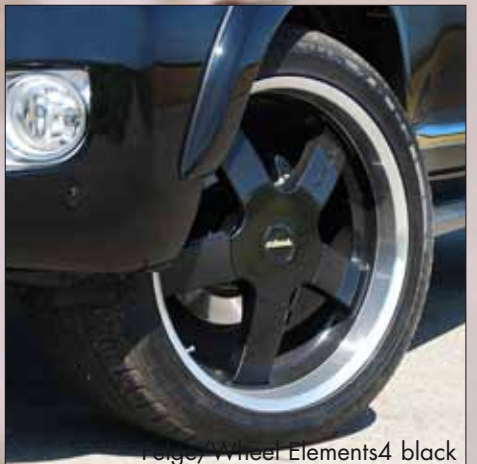
Felge/Wheel Elements4 black