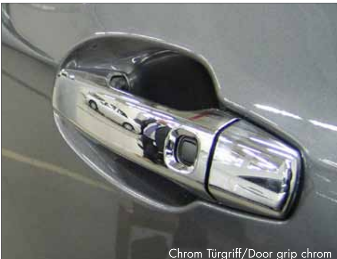
Chrom Türgriff/Door grip chrom