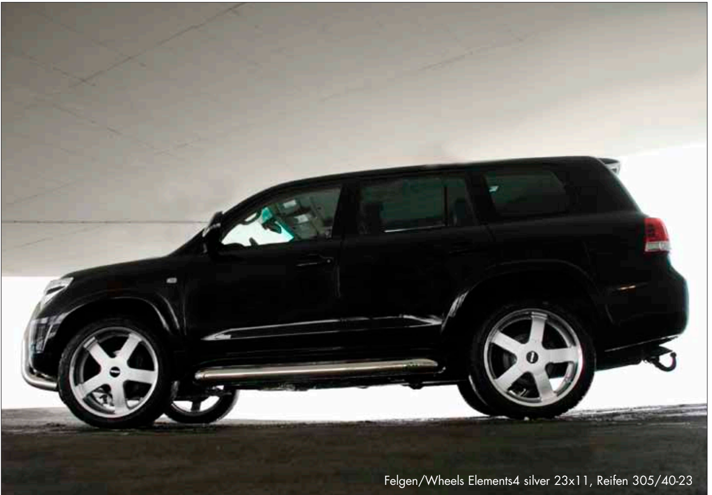
Felgen/Wheels Elements4 silver 23x11, Reifen 305/40-23