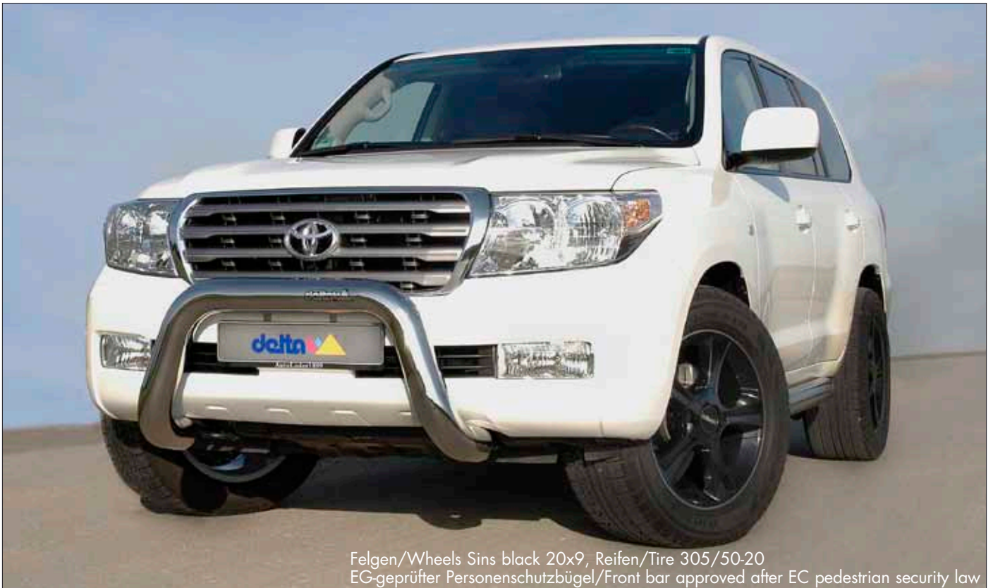
Felgen/Wheels Sins black 20x9, Reifen/Tire 305/50-20 EG-geprüfter Personenschutzbügel/Front bar approved after EC pedestrian security law