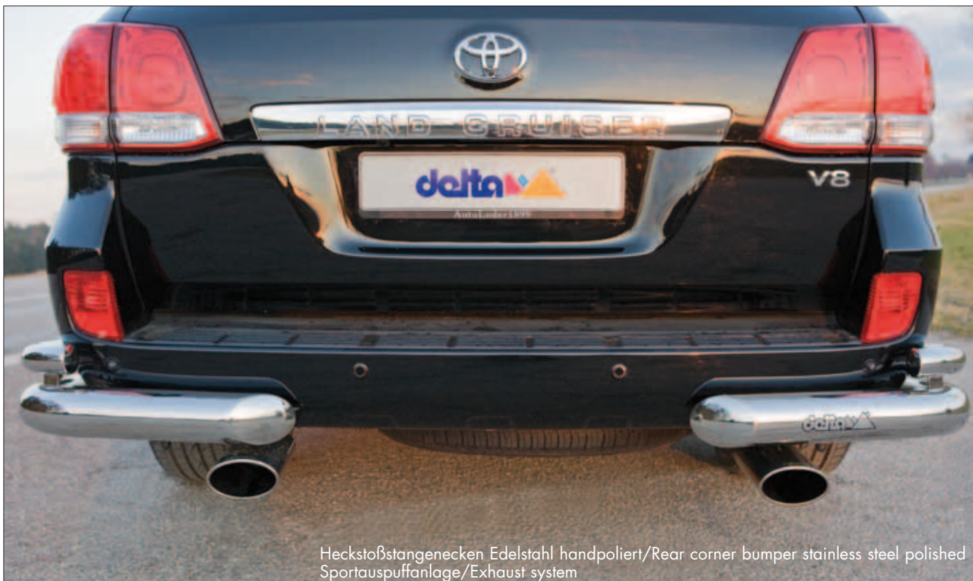
Heckstoßstangenecken Edelstahl handpoliert/Rear corner bumper stainless steel polished Sportauspuffanlage/Exhaust system