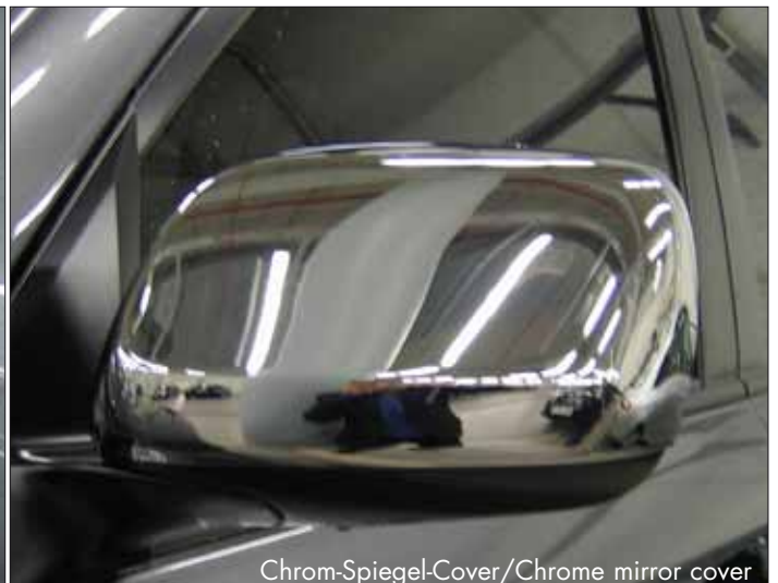
Chrom-Spiegel-Cover/Chrome mirror cover