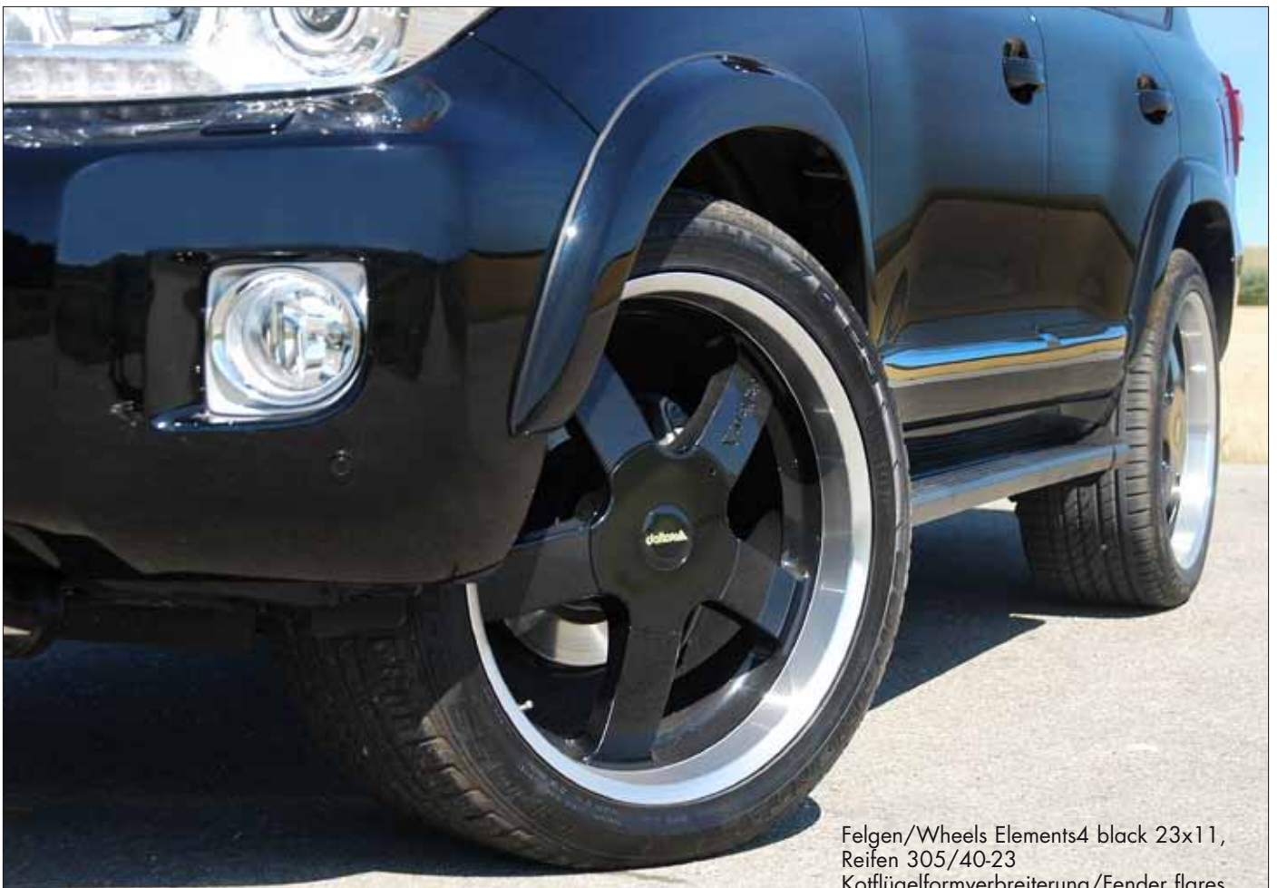
Felgen/Wheels Elements4 black 23x11, Reifen 305/40-23 Kofflügelverbreiterung/Fender flares