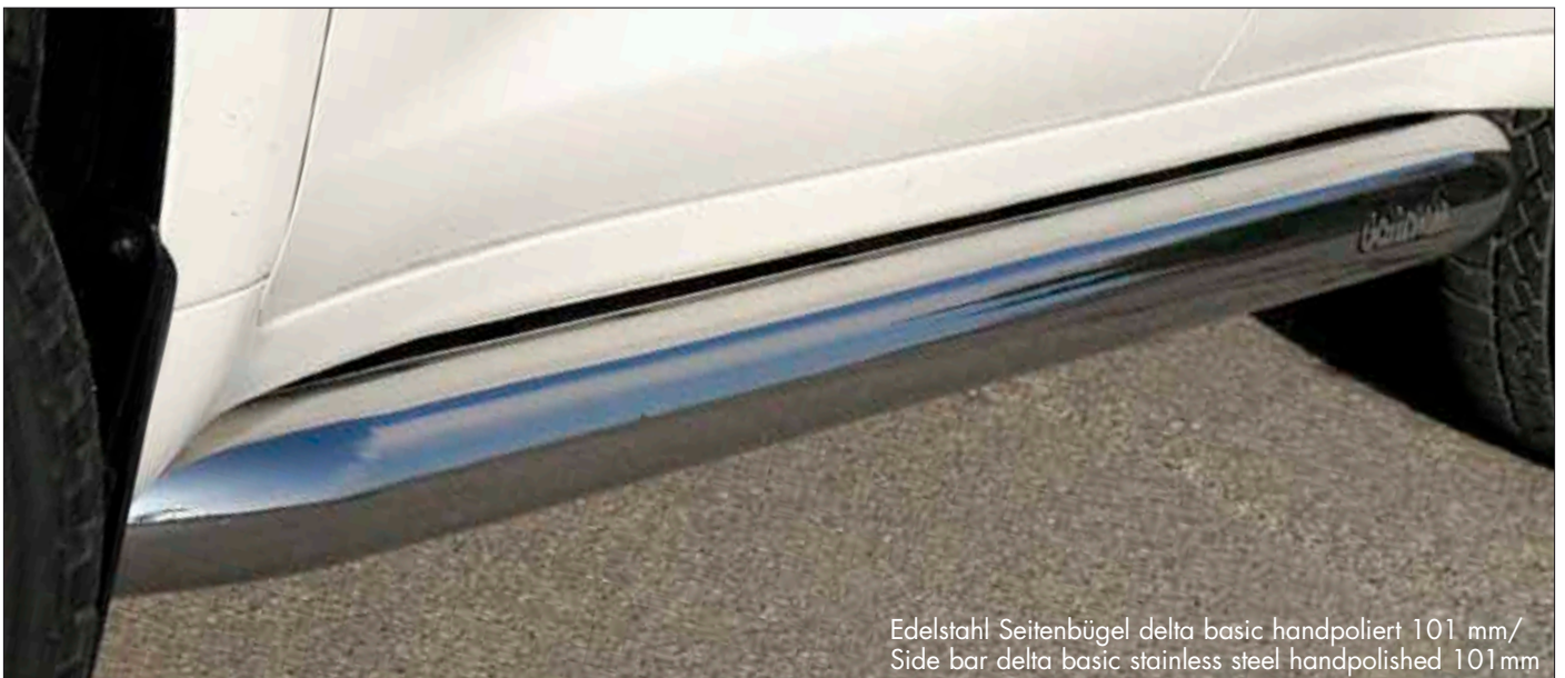
Edelstahl Seitenbügel delta basic handpoliert 101 mm/ Side bar delta basic stainless steel handpolished 101mm