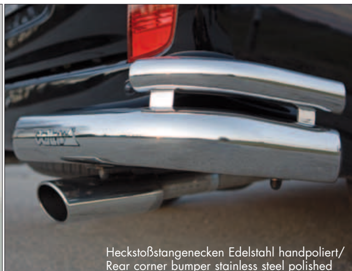
Heckstoßstangenecken Edelstahl handpoliert/ Rear corner bumper stainless steel polished