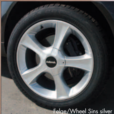
Felge/Wheel Sins silver