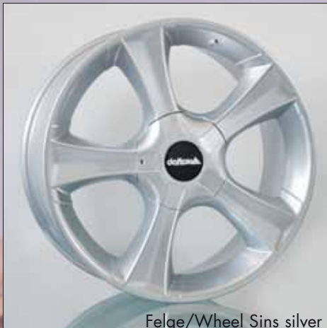
Felge/Wheel Sins silver