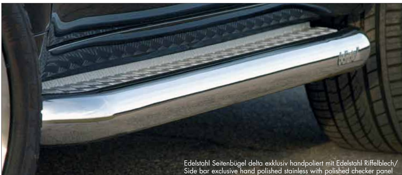
Edelstahl Seitenbügel delta exklusiv handpoliert mit Edelstahl Riffelblech/ Side bar exclusive hand polished stainless with polished checker panel