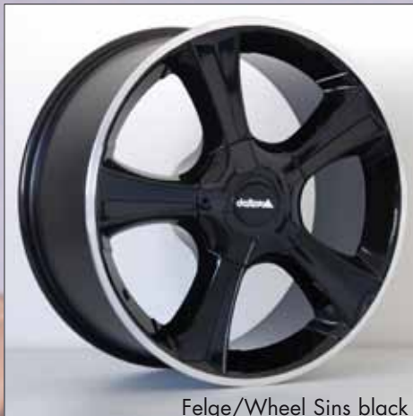
Felge/Wheel Sins black