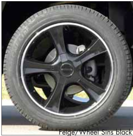
Felge/Wheel Sins black