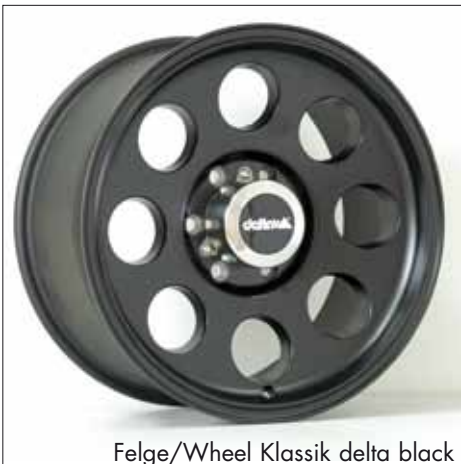
Felge/Wheel Klassik delta black