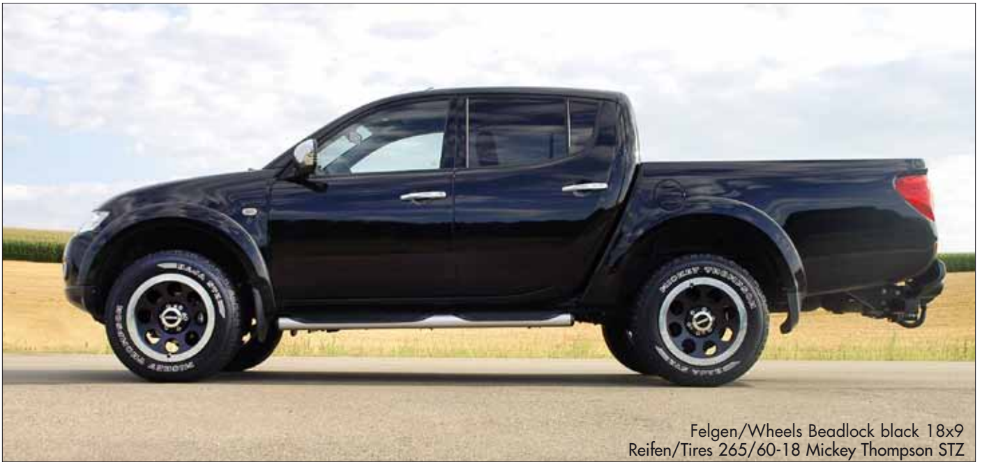
Felgen/Wheels Beadlock black 18x9 Reifen/Tires 265/60-18 Mickey Thompson STZ