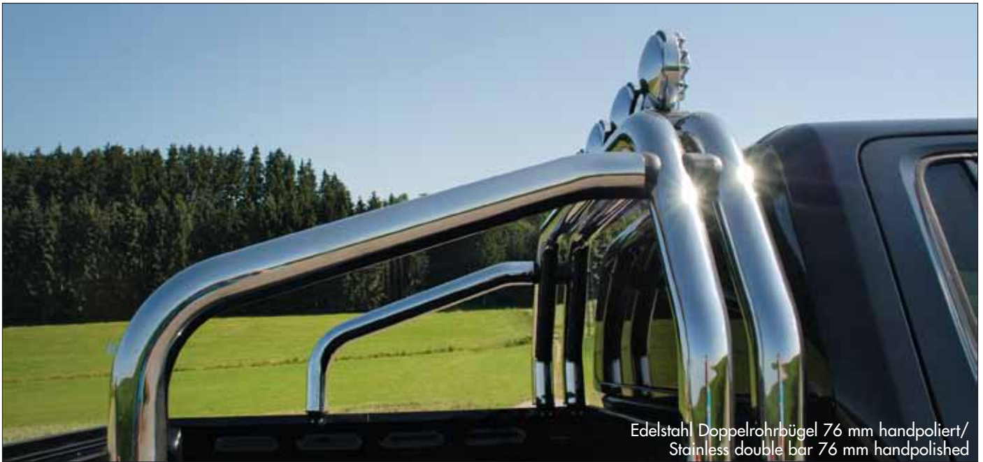
Edelstahl Doppelrohrbügel 76 mm handpoliert/ Stainless double bar 76 mm handpolished