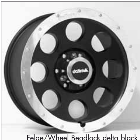
Felge/Wheel Beadlock delta black