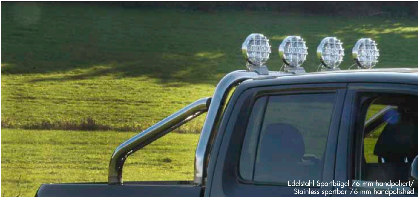
Edelstahl Sportbar 76 mm handpoliert/ Stainless sportbar 76 mm handpolished