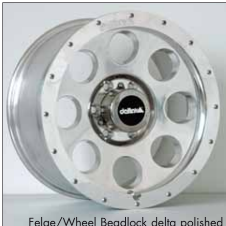
Felge/Wheel Beadlock delta polished