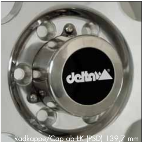
Radkappe/Cap ab IK (PSD) 139,7 mm