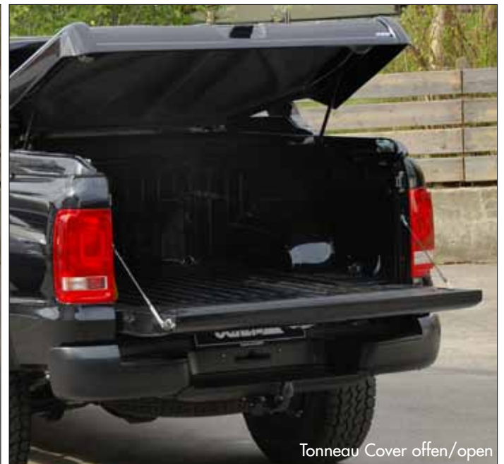
Tonneau Cover offen/open