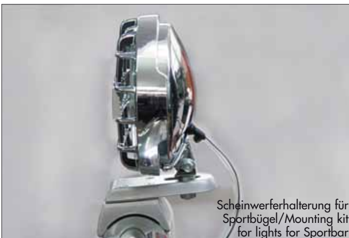
Scheinwerferhalterung für Sportbügel/Mounting kit for lights for Sportbar