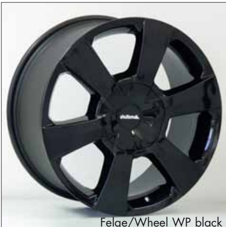
Felge/Wheel WP black