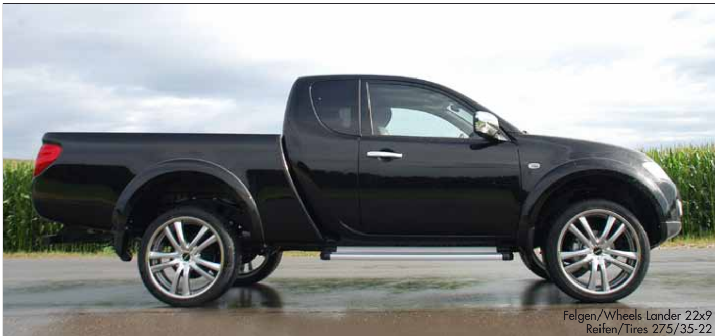
Felgen/Wheels Lander 22x9 Reifen/Tires 275/35-22