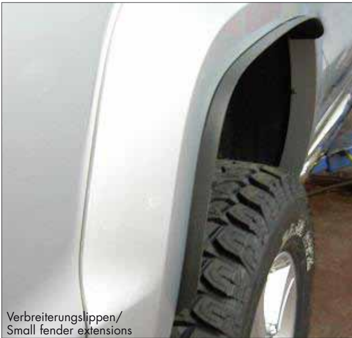
Verbreiterungslippen/ Small fender extensions