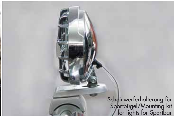
Scheinwerferhalterung für Sportbügel/Mounting kit for lights for Sportbar