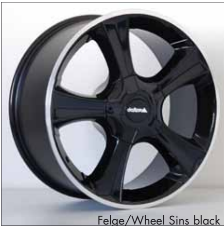
Felge/Wheel Sins black