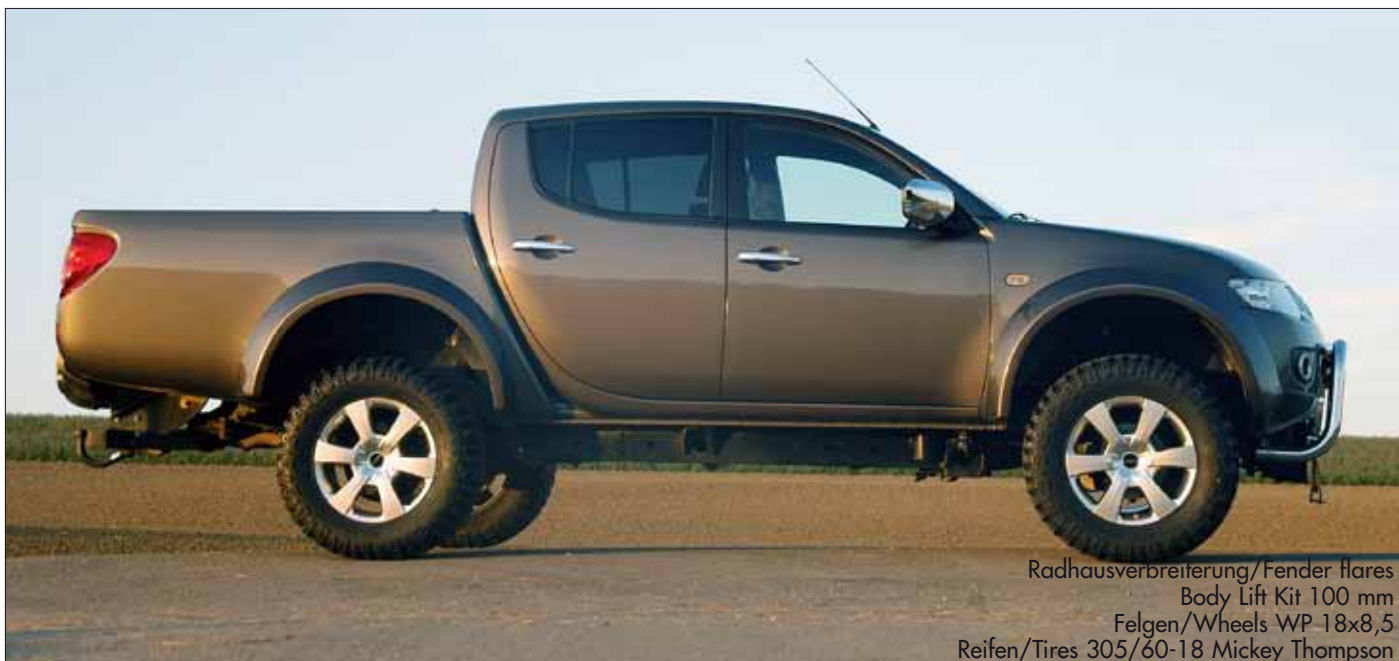
Radhausverbreiterung/Fender flares Body Lift Kit 100 mm Felgen/Wheels WP 18x8,5 Reifen/Tires 305/60-18 Mickey Thompson