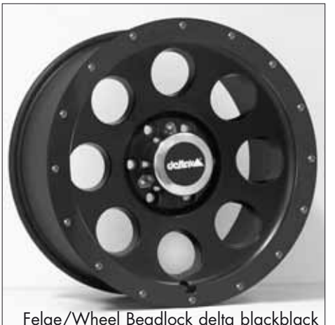
Felge/Wheel Beadlock delta blackblack