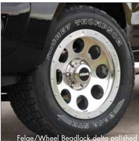
Felge/Wheel Beadlock delta polished