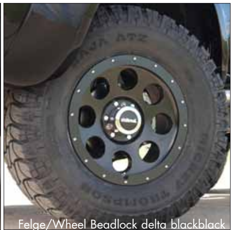
Felge/Wheel Beadlock delta blackblack