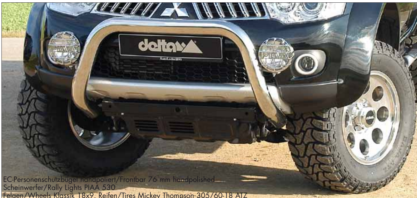
EC-Personenschutzbügel handpoliert/ Frontbar 76 mm handpolished Scheinwerfer/Rally Lights PIAA 530 Felgen/Wheels Klassik 18x9, Reifen/Tires Mickey Thompson-305/60-18 ATZ