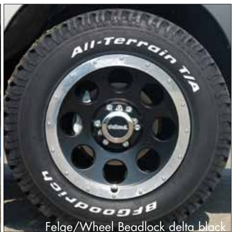
Felge/Wheel Beadlock delta black