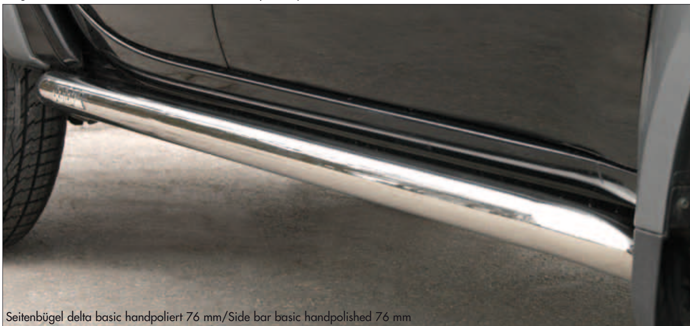
Seitenbügel delta basic handpoliert 76 mm/Side bar basic handpolished 76 mm