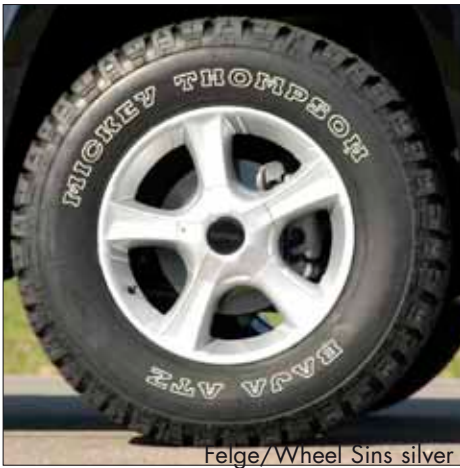
Felge/Wheel Sins silver