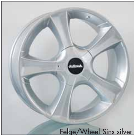
Felge/Wheel Sins silver