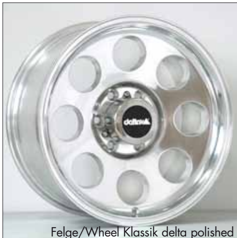
Felge/Wheel Klassik delta polished