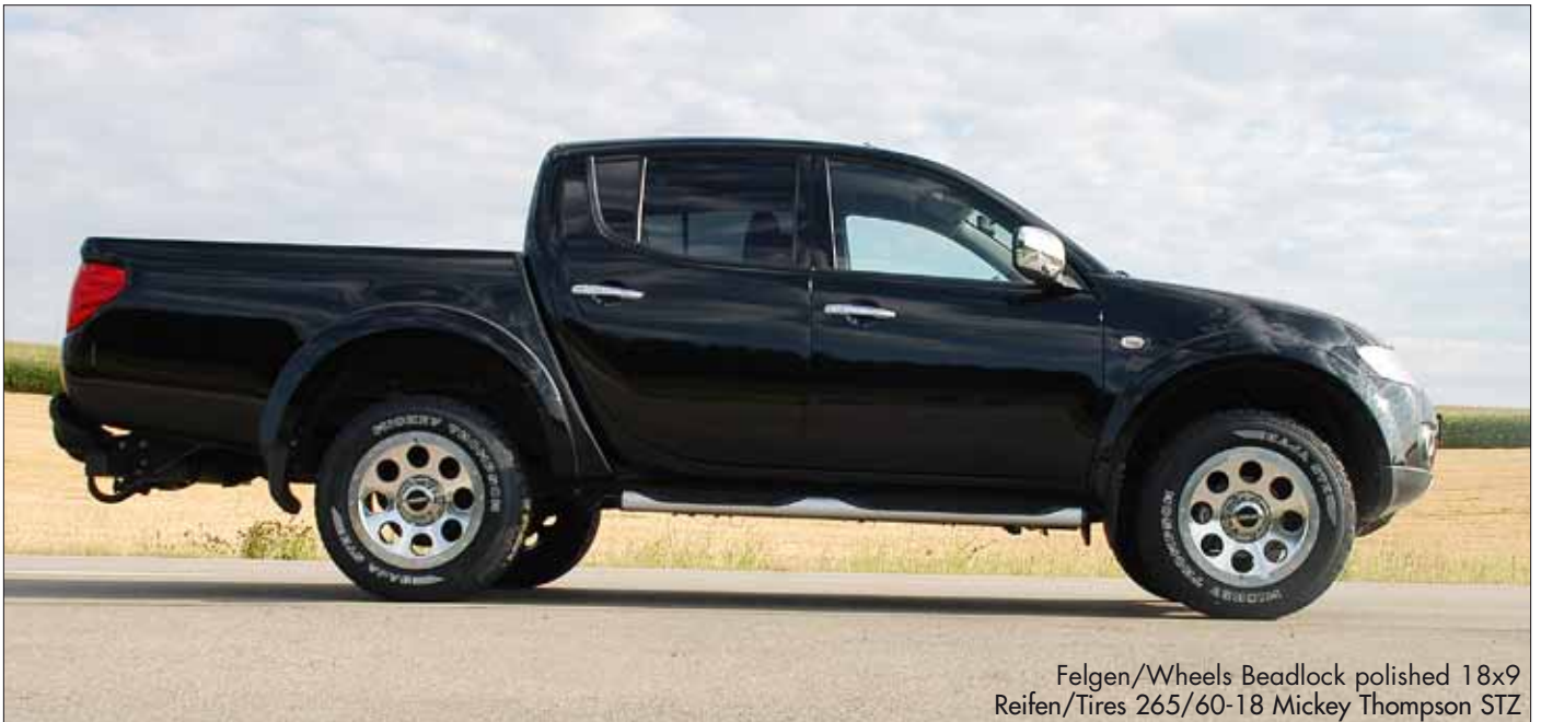
Felgen/Wheels Beadlock polished 18x9 Reifen/Tires 265/60-18 Mickey Thompson STZ