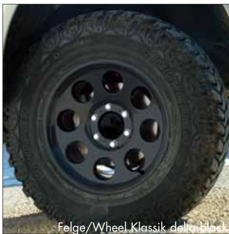
Felge/Wheel Klassik delta black