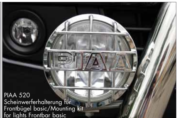
PIAA 520 Scheinwerferhalterung für Frontbügel basic/Mounting kit for lights Frontbar basic