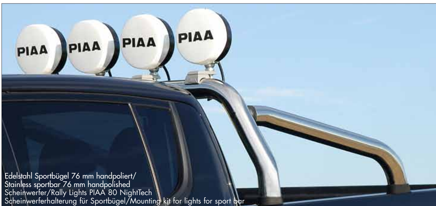
Edelstahl Sportbügel 76 mm handpoliert/ Stainless sportbar 76 mm handpolished Scheinwerfer/Rally Lights PIAA 80 NightTech Scheinwerferhalterung für Sportbügel/Mounting kit for lights for sport bar