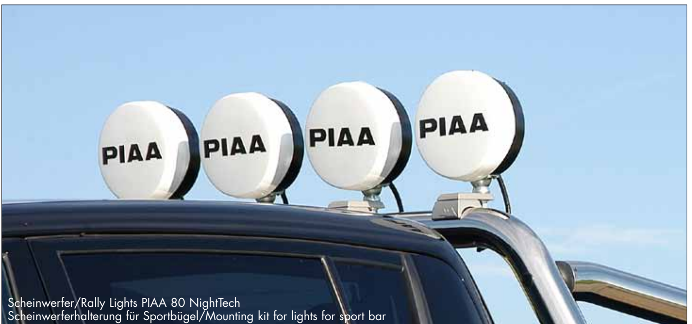
Scheinwerfer/Rally Lights PIAA 80 NightTech Scheinwerferhalterung für Sportbügel/Mounting kit for lights for sport bar