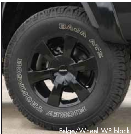
Felge/Wheel WP black