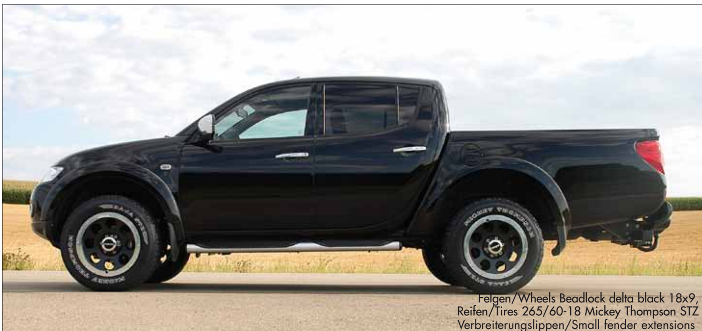
Felgen/Wheels Beadlock delta black 18x9, Reifen/Tires 265/60-18 Mickey Thompson STZ Verbreiterungslippen/Small fender extensions