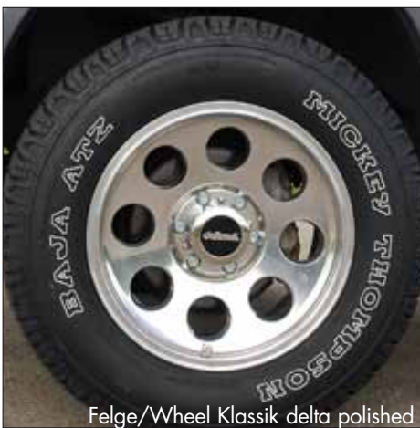
Felge/Wheel Klassik delta polished