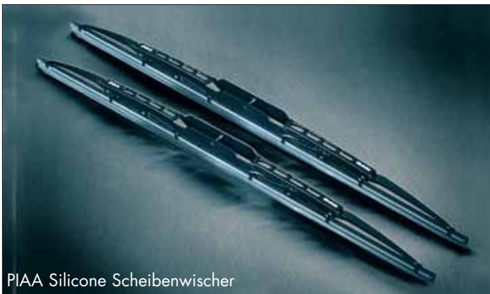
PIAA Silicone Scheibenwischer