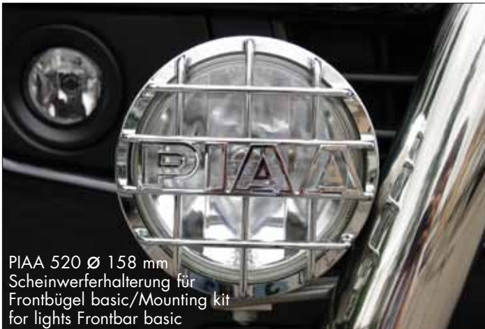
PIAA 520 Ø 158 mm Scheinwerferhalterung für Frontbügel basic/Mounting kit for lights Frontbar basic