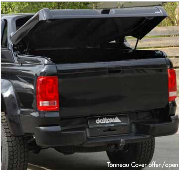
Tonneau Cover offen/open