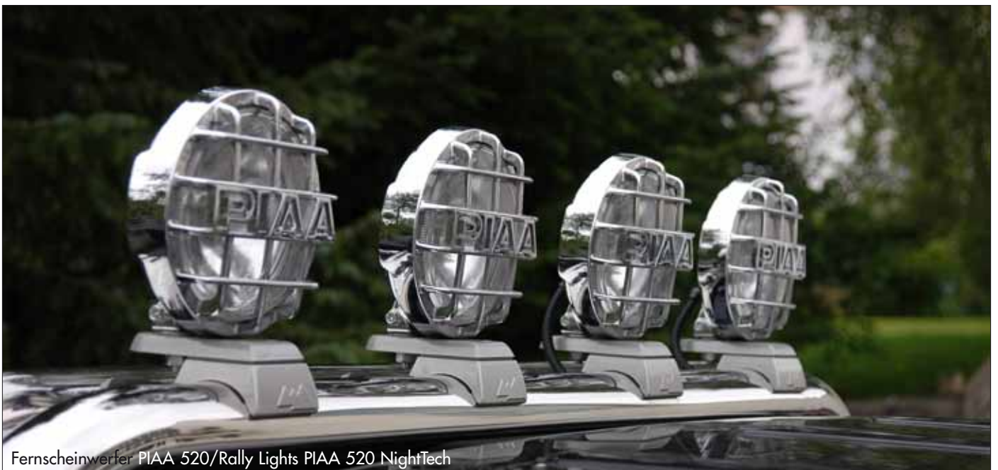
Fernscheinwerfer PIAA 520/Rally Lights PIAA 520 NightTech