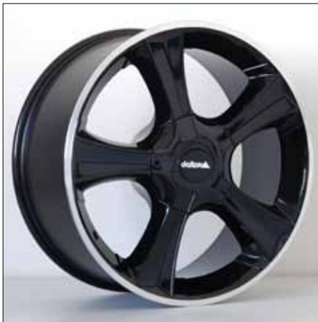
Felge/Wheel Sins black