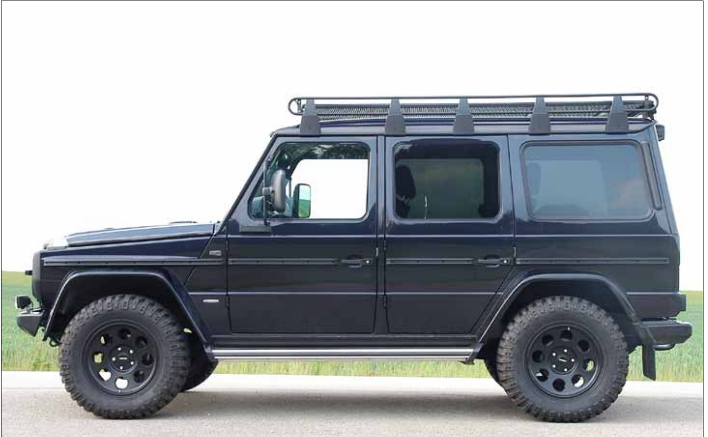
Felgen/Wheels Klassik delta black 18x9