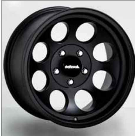
Felge/Wheel Klassik delta black