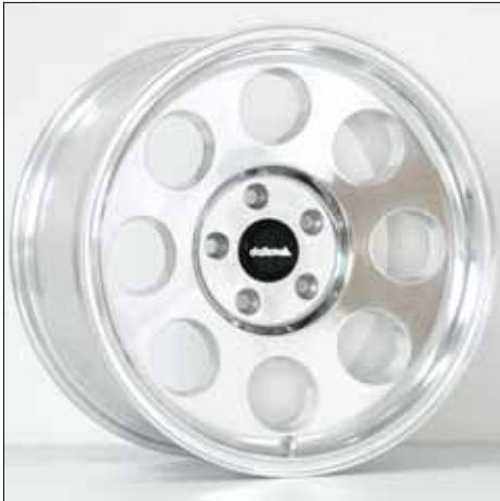
Felge/Wheel Klassik delta polished