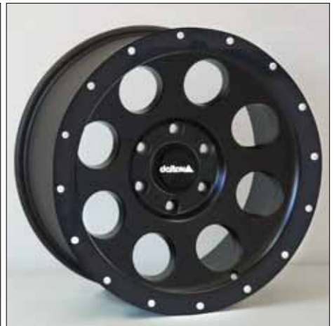
Felge/Wheel Beadlock delta blackblack