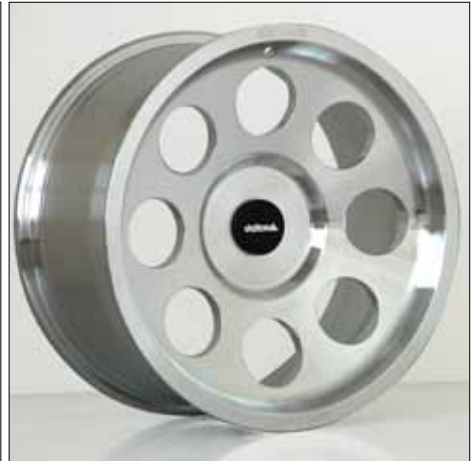
Felge/Wheel Legacy Forged