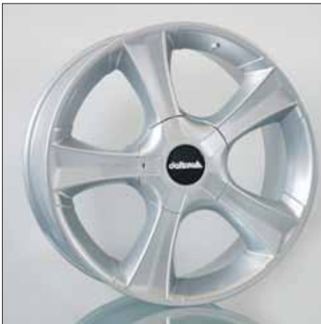
Felge/Wheel Sins silver