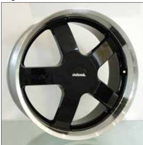
Felge/Wheel E4 black