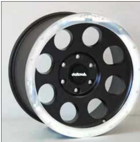
Felge/Wheel Beadlock delta black