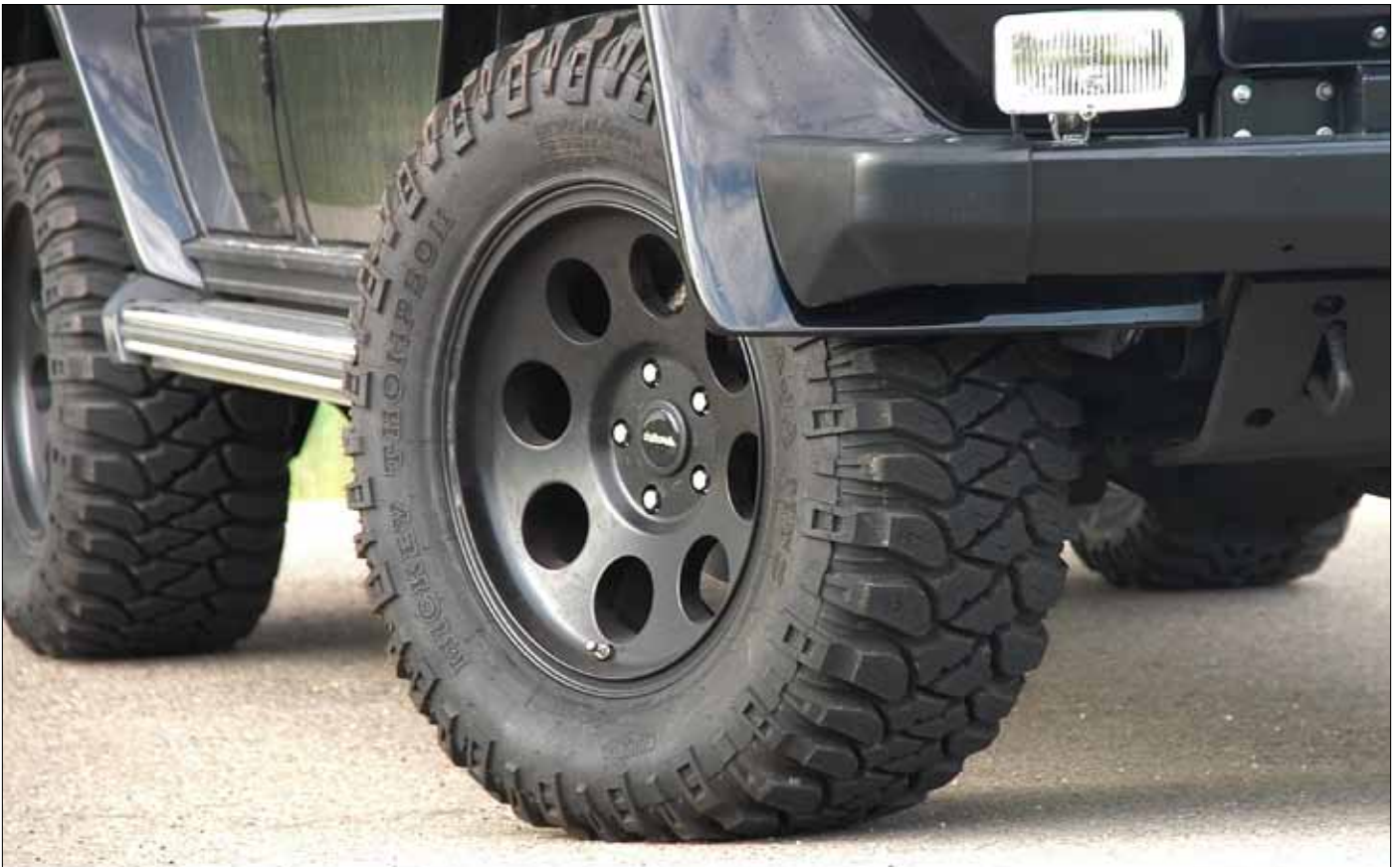
Felgen/Wheels Klassik delta black 18x9