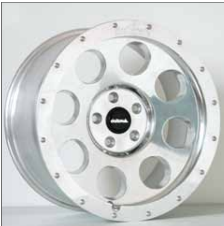
Felge/Wheel Beadlock delta polished