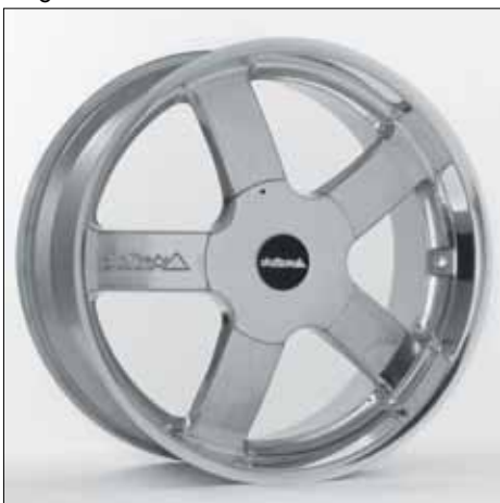
Felge/Wheel E4 silver