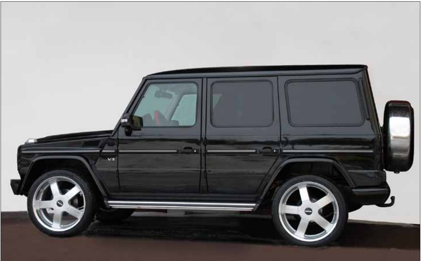
Felgen/Wheels Elements4 23x11